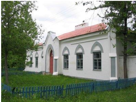
Фото 3. Почтовая станция конца XIX века в д. Паськова Горка