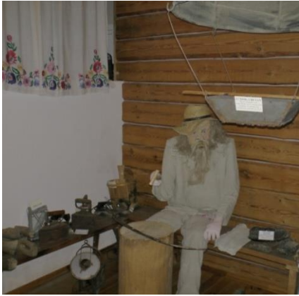
Фото 1. Народный музей «Этнография, история д. Горки» ГУО «Горковская средняя школа Стародорожского района» в аг. Горки