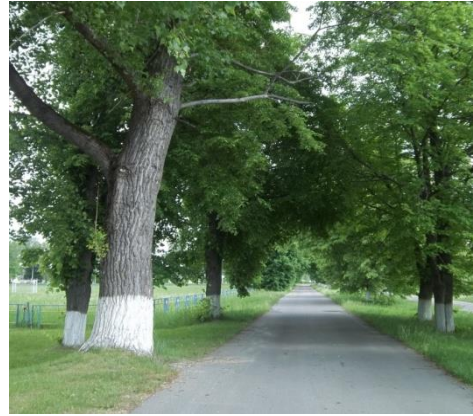
Фото 2. Липовая аллея, которая вела к дому Пересвет-Солтанов